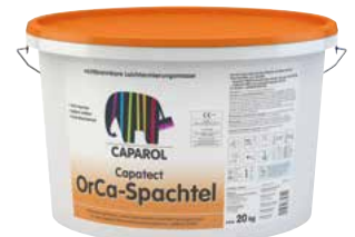
Capatect OrCa-Spachtel Der „Nichtbrennbare“

Weitere Informationen: www.light-to-go.de