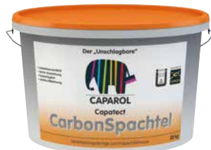
Capatect CarbonSpachtel Der „Unschlagbare“