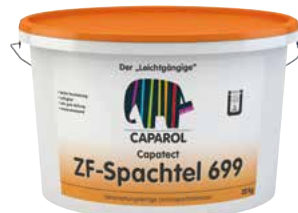
Capatect ZF-Spachtel 699 Der „Leichtgängige“