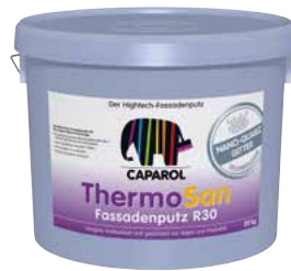
Capatect ThermoSan Fassadenputz NQG Der Hightech-Fassadenputz