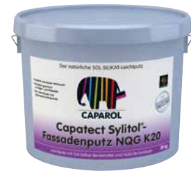
Capatect Sylitol®-Fassadenputz NQG Der natürliche SOL-SILIKAT-Leichtputz